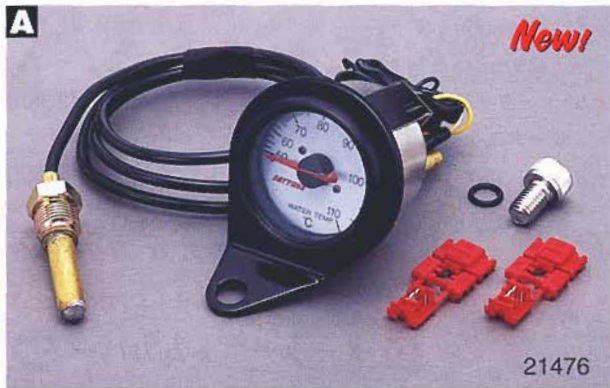
Analog water temperature gauge

文字盤ホワイト、夜間はグリーン透過照明で視認性抜群! 雨天走行時の防水対策済み。専用メータステー、結線コネクタ等必要な物一式付属。